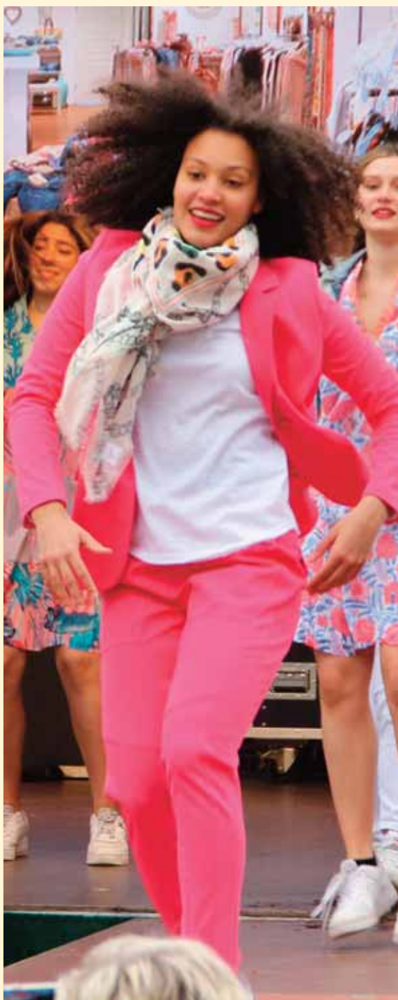
Die Produkt- und Modeschauen beginnen an beiden Tagen um 12 Uhr und um 15 Uhr.