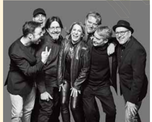
Zwei Tage Frühlingsfest in Kempen: am Samstag mit Live-Musik mit der NIL-Band auf dem Buttermarkt.

werden von einem Prüfer durch den Parcours begleitet: verschiedene Hindernisse wie beispielsweise eine kleine Rampe sind zu überwinden und vorwärts- und rückwärtsfahren sollte man können. Am Ende winkt der Bobby-Car Führerschein. Auf dem Buttermarkt darf man sich auf eine bunte Mischung aus kulinarischen Köstlichkeiten, erfrischenden Cocktails und fruchtiger Bowle von verschiedenen Foodtruck freuen. Auf der Engerstraße bietet ein Streetfoodstand ausgesuchte italienische Köstlichkeiten an. Neu sind in diesem Jahr die bereits erwähnten Holzhütten, die Platz bieten für bis zu acht Personen und auf dem Buttermarkt sowie der Ellenstraße am Bärenbrunnen zu finden sind.