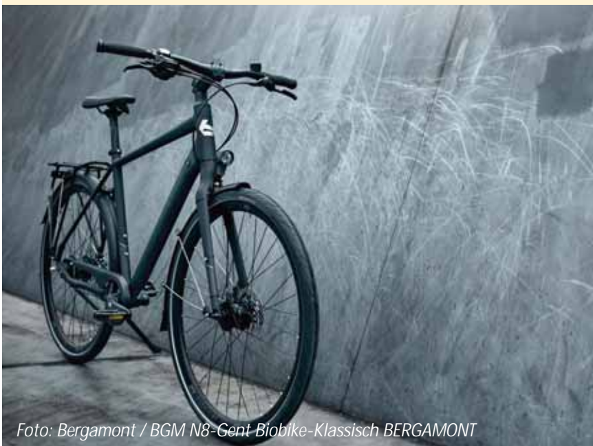
BGM N8-Cent Blobike-Klassisch BERGAMONT