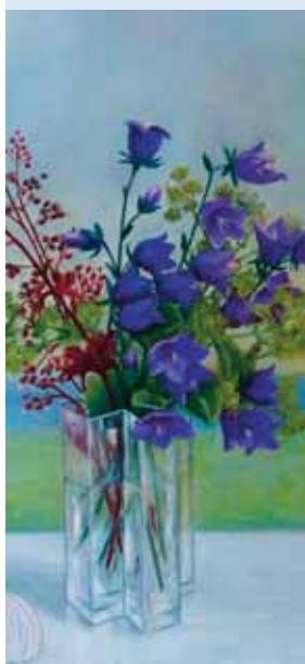
Anne-Dore Trapp, Glockenblumen, Öl auf Leinwand.

Oedt. Das private Kunst-Atelier x-art-3 in Grefrath-Oedt, An der Kleinbahn 3, zeigt Arbeiten der Künstlerinnen Anne-Dore Trapp aus Meerbusch und Isolde Schmitz-Becker aus Straelen. Die Doppelausstellung wird am heutigen Freitag, 5. April um 17 Uhr eröffnet und ist danach samstags von 15 bis 18 Uhr sowie sonntags von 11 bis 17 Uhr geöffnet.