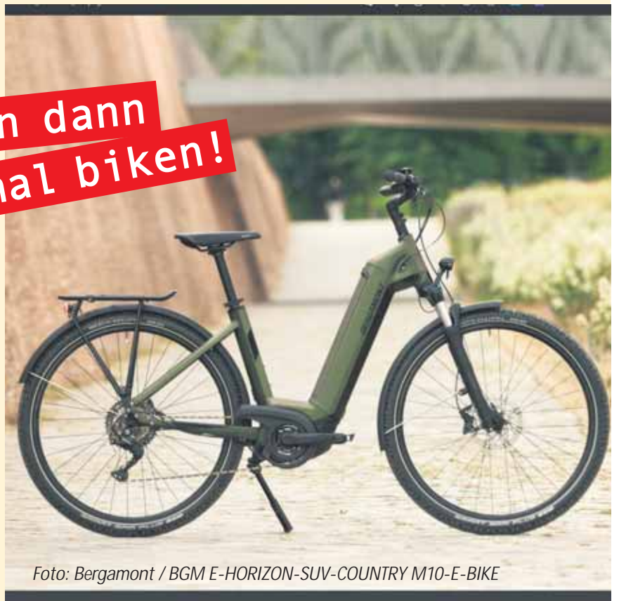
BGM E-HORIZON-SUV-COUNTRY M10-E-BIKE