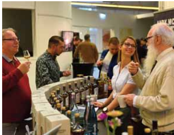
Die 4. Kempener Whisk(e)y-Konferenz beginnt am 19. April um 16 Uhr.

Die Konferenz öffnet am Freitag um 16 Uhr für die Messebesucher. Neben der Hauptveranstaltung im Saal werden zwei Auftaktveranstaltungen als Special Tastings in der separaten Lounge angeboten. Ein Tasting wird das Thema „Alte Traditionen vs. New World Whisky“ haben. Was da aktuell an Innovation und neuer Machart in die Whiskypro-